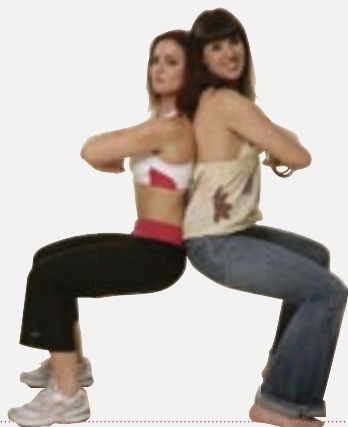
Pour la coach, impossible de dissocier sport et régime.